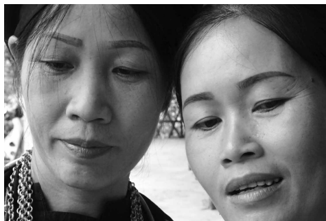
Freiwillige Begleiterinnen von SeniorInnen in Ha Giang.

Ganz im Norden, in der Provinz Ha Giang, wird ein etwas anderes Modell gelebt: generationenübergreifende Selbsthilfe-Clubs. medico international schweiz leistet auch hier Starthilfe. Die Betreuung alter Menschen durch Freiwillige bildet auch in diesen Clubs einen Schwerpunkt. Es ist auffallend, dass unter den hier lebenden Minderheiten die Frauen nicht nur die Mehrheit unter den Freiwilligen stellen, sondern auch in den Clubs und deren Vorständen eine tragende Rolle einnehmen.