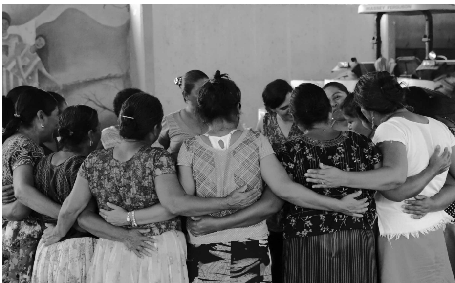
Frauen aus San Dionisio del Mar, Oaxaca, geben im Workshop von Codigo DH ihrer Verbundenheit Ausdruck.

Interessen von Windparkprojekten und Korruptionsgeldern verschieben. Dank des beharrlichen Widerstandes der Asamblea wird es gelingen, dass die Wahlen schlussendlich abgesagt werden.