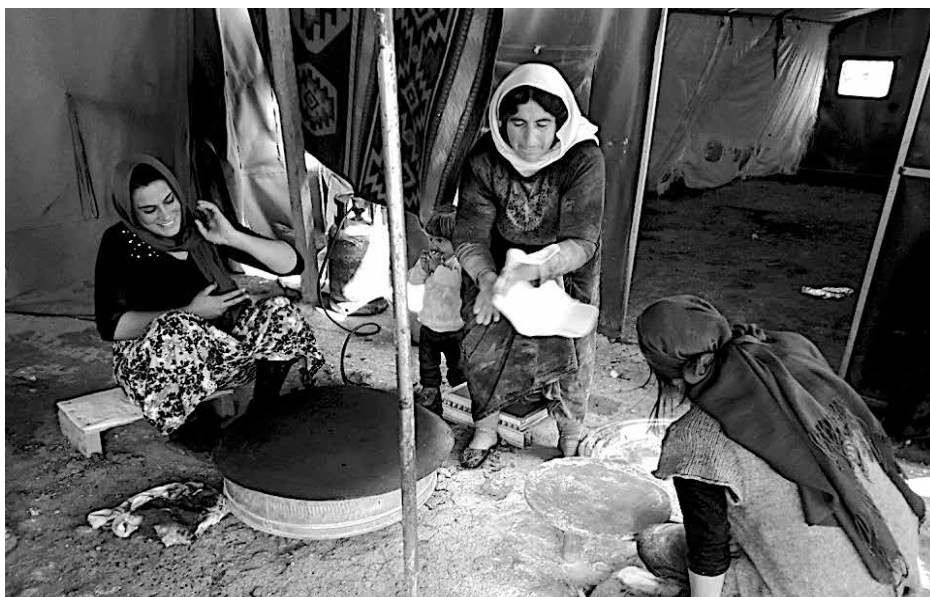
Ezidische Frauen in Shengal bei der Zubereitung von Fladenbrot.

In den kurdischen Gebieten innerhalb der türkischen Staatsgrenzen herrscht