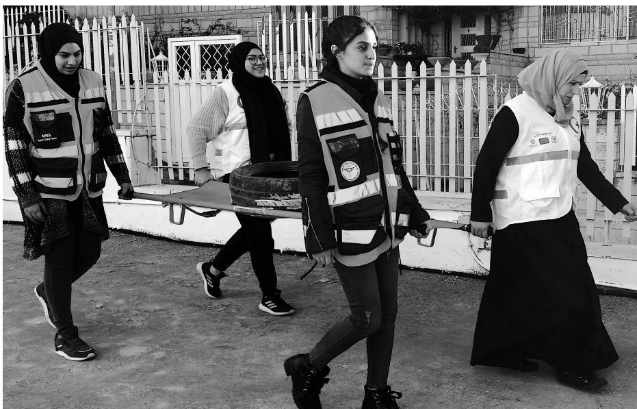
Das Heben und Tragen von Personen auf einer Bahre erfordert Koordination und Teamgeist. Im Training wird dies mit einem alten Autoreifen geübt.