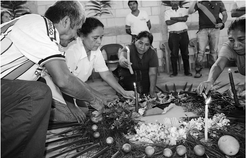
Um die Gemeinschaft zu stärken kommen alte Bräuche wieder zum Zuge. Eine Maya-Zeremonie in Primavera zur Eröffnung einer AGPD-Versammlung.