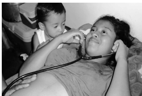
Die erfahrenen Hebammen sind für die Mädchen und Frauen wichtige Ansprechpersonen.

Mit unglaublicher Konstanz und unermüdlichem Einsatz setzen sich die Heb-