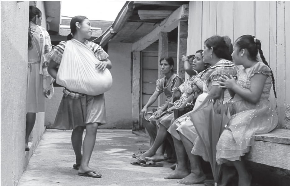
Die Frauen nutzen die Frauensprechstunde im kommunalen Gesundheitshaus.

Wie nicht anders zu erwarten, schlägt der mexikanische Staat zurück und bekämpft um der politischen und wirtschaftlichen Macht willen jegliches autonome Handeln und die lokalen