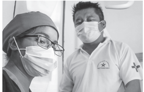
Auch die Zahnmedizin gehört zum Angebot in den zapatistischen Kliniken.

viele nicht genügend Spanisch sprechen, kann die Begleitung durch ausgebildete ÄrztInnen schlechte Behandlung der indigenen PatientInnen vermindern.